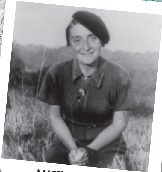
MADELEINE DELBRÊL « Communautés selon l'Évangile »

« Vivre dans l'Église, à la date d'aujourd'hui, les paroles, les gestes, les conseils du Christ. Le faire simplement, un peu à la lettre, à la manière des gens qui entendraient l'Évangile pour la première fois... »